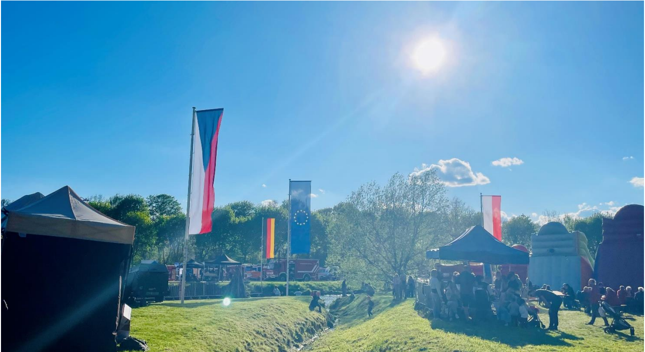
Dreiländerpunkt - Europafest 2024